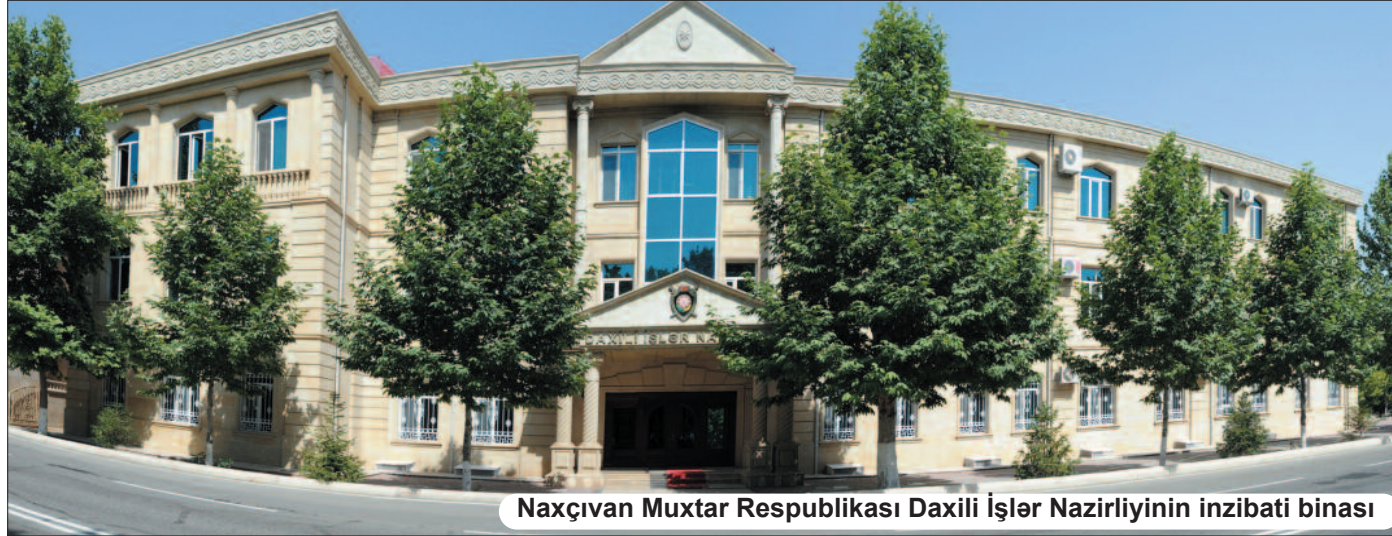
Naxçıvan Muxtar Respublikası Daxili İşlər Nazirliyinin inzibati binası

xalqımızın keşiyində duran mübariz bir orqandır”, – deyən ümummilli liderimizin həyata keçirdiyi kadr islahatları peşəkarlığın artırılmasına, xidmətin səmərəli təşkilinə zəmin yaratdı. Qanunların aliliyinin təmin olunması, dövlətçilik prinsiplərinin ön plana çəkilməsi ölkədə cinayətkarlıqla mübarizənin möhkəm təməlini qoydu. Daha şəxsiyyətin 1994-cü il avqustun 9-da imzaladığı “Cinayətkarlığa qarşı mübarizənin gücləndirilməsi, qanunçuluğun və hüquq qaydasının möhkəmləndirilməsi tədbirləri haqqında” Fərman mütəşəkkil cinayətkarlıqla mübarizənin təşkili-hüquqi bazasının əsası qoyulmuşdur. Qanunvericilik bazasının təkmilləşdirilməsi sonrakı dövrdə də davam etdirilərək “Polis haqqında”, “Əməliyyat-axtarış fəaliyyəti haqqında” qanunlar, “Daxili işlər orqanlarında xidmətkeçmə haqqında Əsasnamə” qəbul edilmişdir. Qanunların aliliyini rəhbər tutan hüquq-mühafizə orqanlarının qətiyyətlə həyata keçirdikləri əməliyyatlar nəticəsində kriminogen durum nəzarətə alınmışdır. Nəticədə, ağır cinayətlərin sayı kəskin surətdə azalmış və Azərbaycan ən sabit ölkələrdən birinə çevrilmişdir.