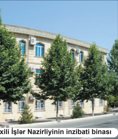
Naxçıvan Şəhər Polis İdarəsinin inzibati binası

Muxtar respublikamızda da polis orqanları diqqət və qayğı ilə əhatə olunmuşdur. Son 20 il ərzində Naxçıvan Muxtar Respublikası daxili işlər orqanlarının maddi-texniki bazası ən müasir səviyyəyə çatdırılmış, fəaliyyətin günün tələbləri səviyyəsində təşkili təmin edilmişdir. Ötən